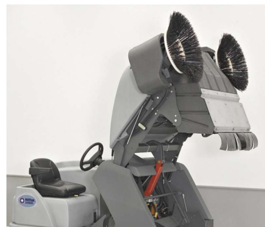
La SW8000 tiene una gran capacidad en su tolva de 152 cm desde el nivel del suelo para un llenado práctico.