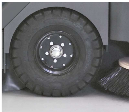
Sus grandes ruedas permiten un manejo suave.